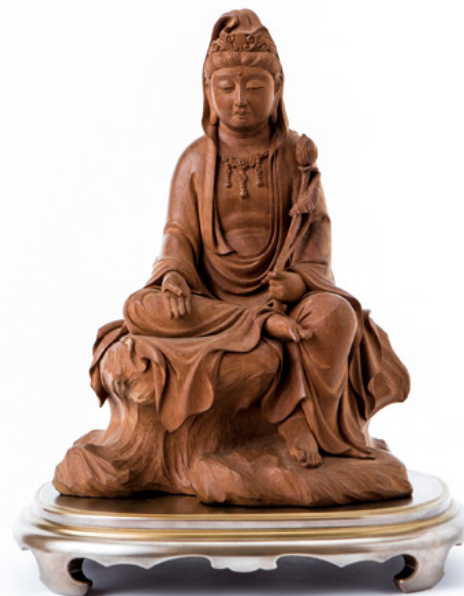
高村光雲 Takamura Koun

白衣観音 "Byakue Kannon" 17.5cm-12cm-23.2cm(h) 昭和七年秋季作 1932 Autumn